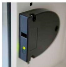
Zamek z okablowaniem RFID