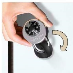
Bezpieczny zamek kłódkowy