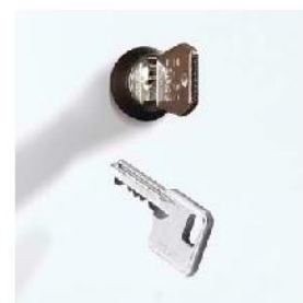
Zamek cylindryczny do 6.000 różnych kombinacji