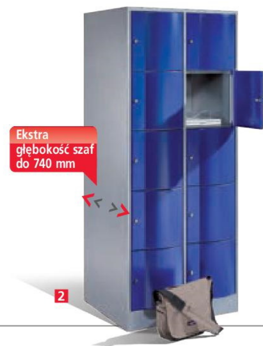
Szafa schowkowa wariant mieszany kombinacja 2 i 4 schowków w pionie, duże schowki z drążkiem i 3 haczykami