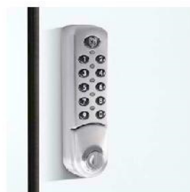
Zamki offline na kod PIN