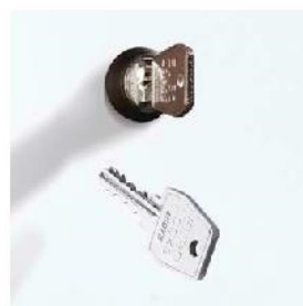
Zamek cylindryczny do 1.000 różnych kombinacji