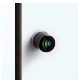
Elektryczny zamek bateryjny Offline Basic