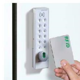
Zamki offline PIN, RFID, NFC