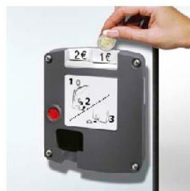
Zamek na monetę z funkcją kasującą