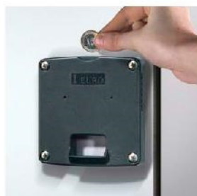
Zamek na monetę