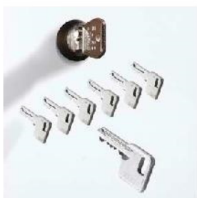
Zamek cylindryczny w systemie Master

✓ w standardzie - brak w ofercie ● rekomendowany ◐ odpowiedni ○ niezalecany