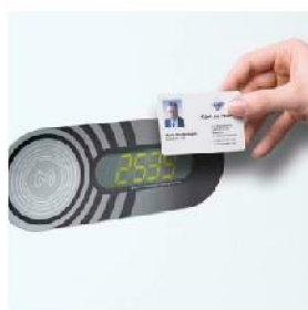
Zamek Online na transponder (z nośnikiem danych)