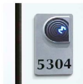
Opis zamków online