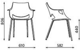
FANO 4L waga: 5,40 kg